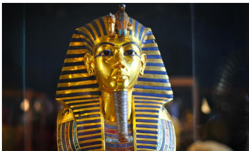
Рис. № 1.