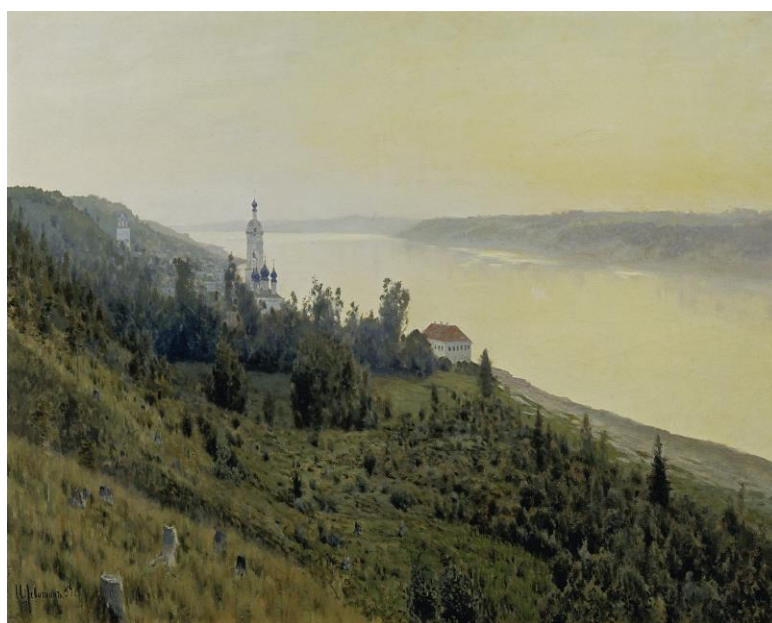
Рис. №2. «Вечер. Золотой Плѣс»