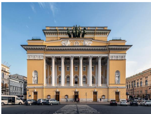
Рис. №1. Фасад Александрийского театра.

Прочитайте текст об Александрийском театре в Санкт-Петербурге и обратите внимание на выделенные термины. Найдите определения выделенных терминов, данные под текстом.